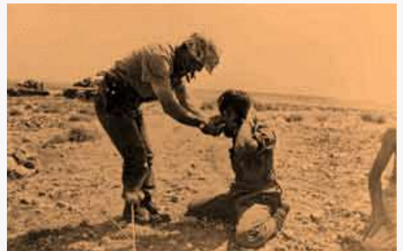
Προπαγανδιστική φωτογραφία των Τούρκων που εμφανίζει έναν Υπαξιωματικό τους, να προσφέρει τσιγάρο σε Ελληνοκύπριο που μόλις έχει συλληφθεί αιχμάλωτος. Αμέσως μετά τη φωτογράφιση ο αιχμάλωτος εκτελέστηκε...