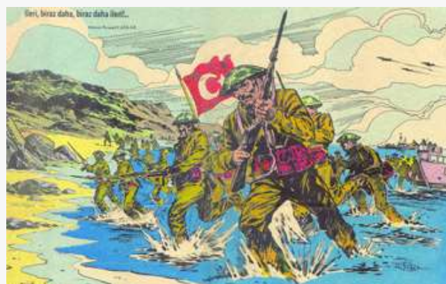
Προπαγανδιστικά φυλλάδια που ρίχθηκαν από τα Τουρκικά αεροσκάφη στα πλαίσια του ψυχολογικού πολέμου και αφίσα της απόβασης των Τούρκων στην Κύπρο.